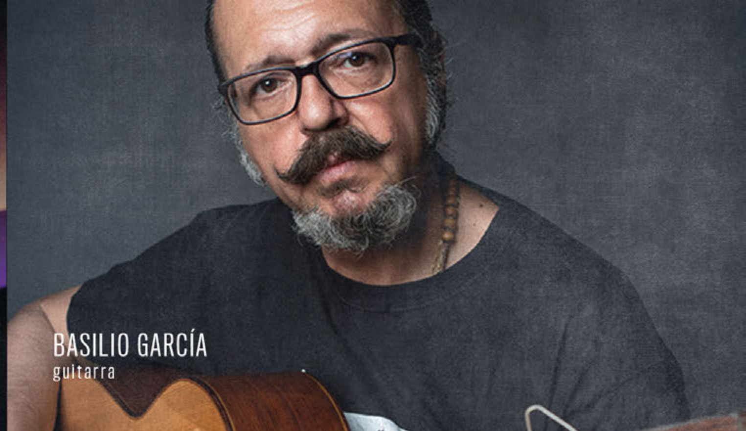
BASILIO GARCÍA guitarra

Ha viajado por todo el mundo actuando en los principales escenarios para el público más exigente. También podemos encontrarle en cameos de películas de Pedro Almodóvar o con Mónica Cruz en la serie Velvet Colección.