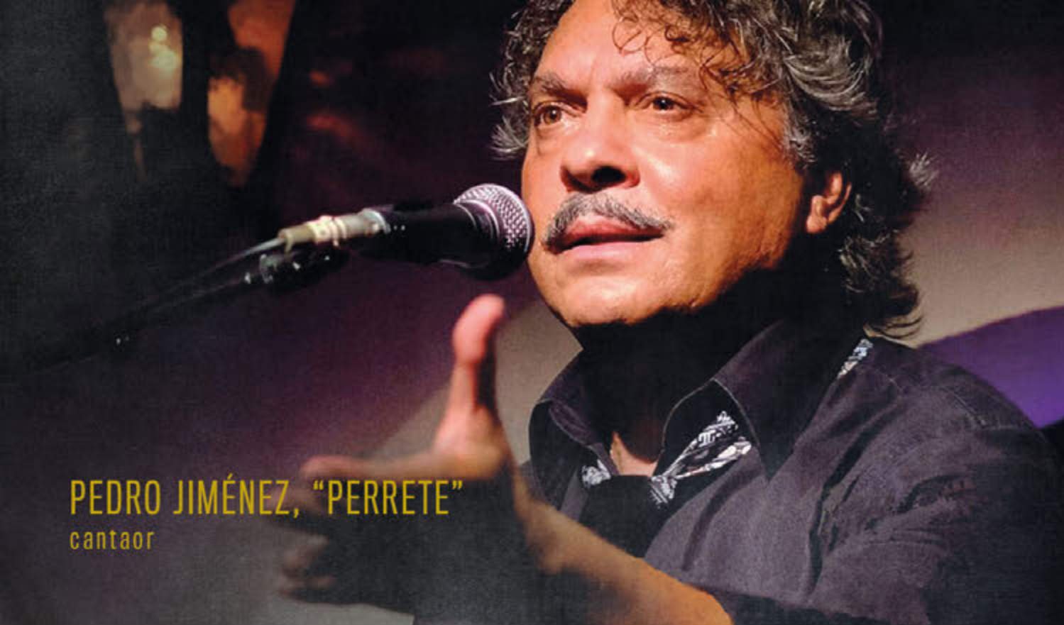
PEDRO JIMÉNEZ, "PERRETE" cantaor

Artista emblemático de la historia del flamenco, una cara conocida en todos los tablaos y escenarios del mundo. Perrete es flamenco en esencia, el que le ha visto actuar sabe perfectamente de lo que hablamos.